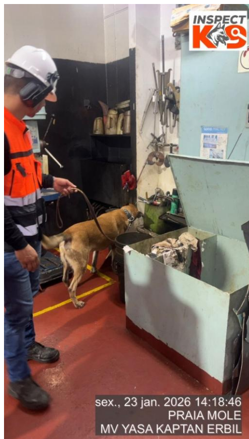
Figura 2 – Procedimento de checagem em área da casa de máquinas do navio

O valor relacionado ao custo da inspeção, com duração de até 06 horas, se encontra no valor de R$5.800,00.