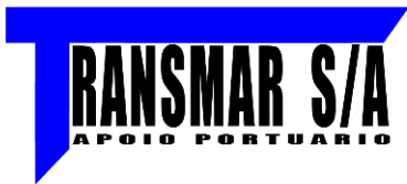
TABELA COMERCIAL Nº 006/25

LOCAL/DATA: Vila do conde Barcarena Pá, 06 de maio de 2025